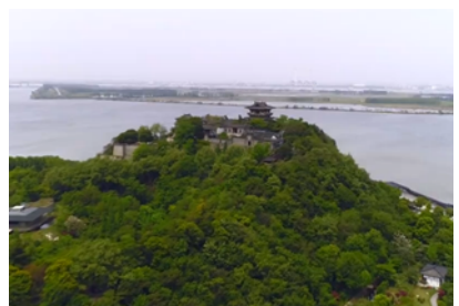
镇江：山水之城 宜居乐游