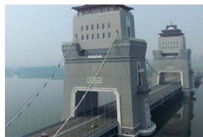
扬州：万福大桥 移步异景